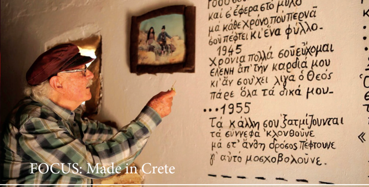
FOCUS: Made in Crete